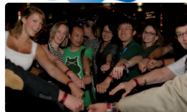
Vorfreude auf die Stadtführung.