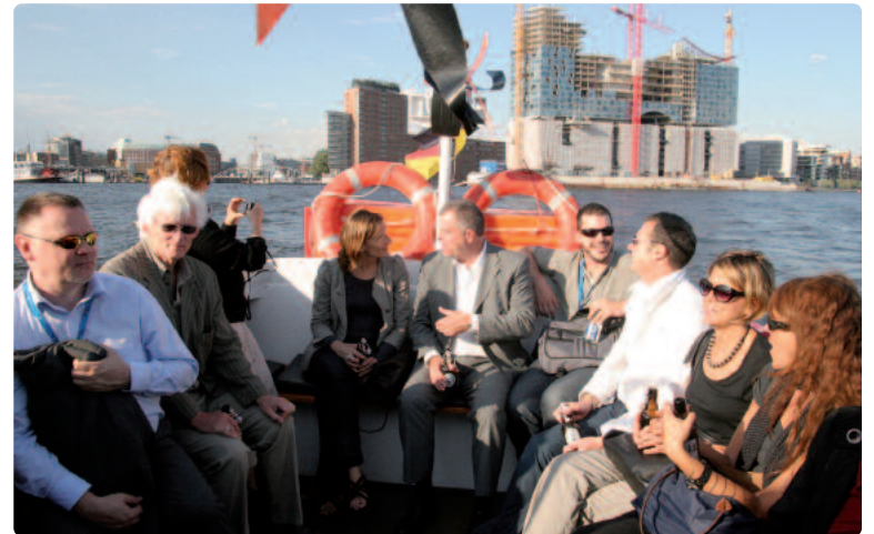
Entspannte Stimmung bei der Hafentour.