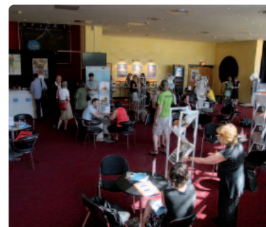
Geschäftiges Marktreiben im Cinemaxx.